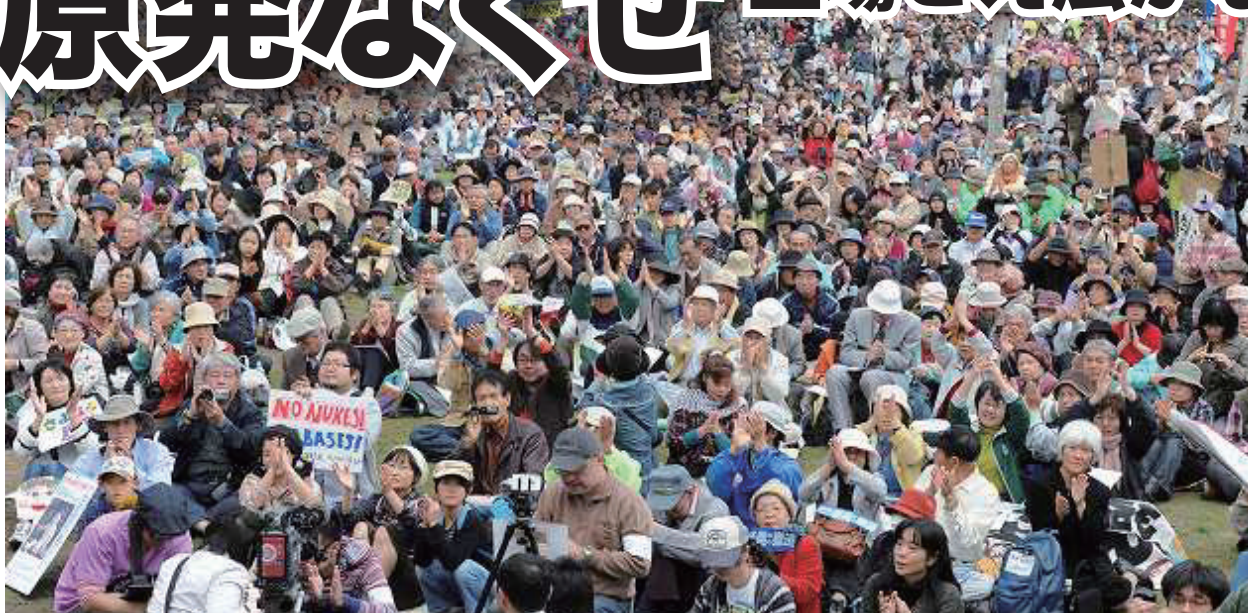
「もう原発はやめよう」と、九州・沖縄などの各地から集まった人たち＝11月13日、福岡市の舞鶴公園

「1万5千人も集まり、市民一人ひとりが声をあげ続けることの大切さを改めて感じました」「私たちの願い（原発ゼロ）が現実になる日がきつと来ると信じて、がんばりましょう」 「九州・沖縄・韓国に住む市民でつくるさよなら原発！ 福岡1万人集会」（同実行委員会主催、11月13日、福岡市舞鶴公園）に つどった人々の感想と決意です。「原発なくせ」の一点で九州・沖縄、山口・広島などから様々な団体・個人が総結集しました。 いま、野田政権と電力会社、財界がねらう原発の再稼働を許さず、原発ゼロ社会実現へ、一人ひとりが声をあげるときです。「原発からの撤退を求める署名」に、ご協力ください。