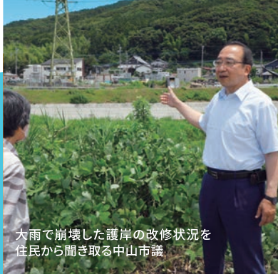
大雨で崩壊した護岸の改修状況を住民から聞き取る中山市議