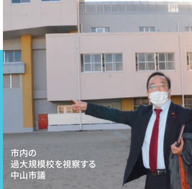
市内の過大規模校を視察する 中山市議