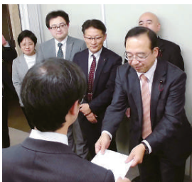
紹介議員になる松尾市議（左端）