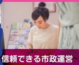
信頼できる市政運営